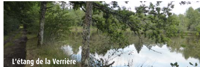
L'étang de la Verrière